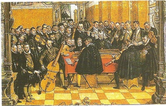
La capilla de la corte de Múnich bajo la dirección de Orlando di Lasso (tocando la espineta).

Giovanni Pierluigi da Palestrina (1525-1594 aprox.), uno de los más grandes compositores del Renacimiento, trabajó, entre otros lugares, como maestro de capilla en la iglesia de San Pedro de Roma. Se dedicó casi exclusivamente a la música religiosa. Así, compuso, por ejemplo, más de cien misas (la más famosa de todas es la Missa Papae Marcelli ) y más de trescientos motetes. Sus obras religiosas, que destacan por su equilibrio rítmico y melódico, así como por la inteligibilidad del texto, fueron en su época y también más tarde el modelo para la música religiosa.