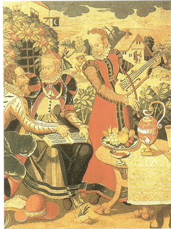
Escena musical en una taberna reproducida en un tapiz.

En el virginal (lat. virga = rama, vara) las cuerdas son pulsadas con plectros al hundir las teclas. En Inglaterra este instrumento en forma de caja fue especialmente popular.