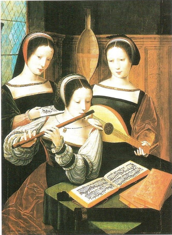
Tres mujeres músicas interpretan una chanson francesa. La cantante está acompañada por una flauta travesera y un laúd renacentista (el principal instrumento doméstico en el siglo XVI).